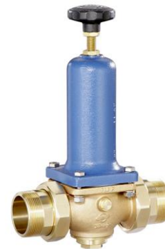
DN 40 - DN 65