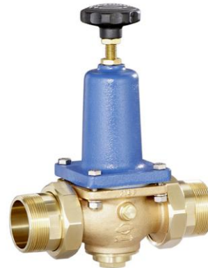
DN 40 - DN 65